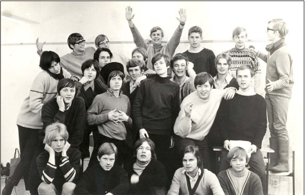
Täältä tullaan elämä. Tapiolan yhteiskoulun 7 D luokka.